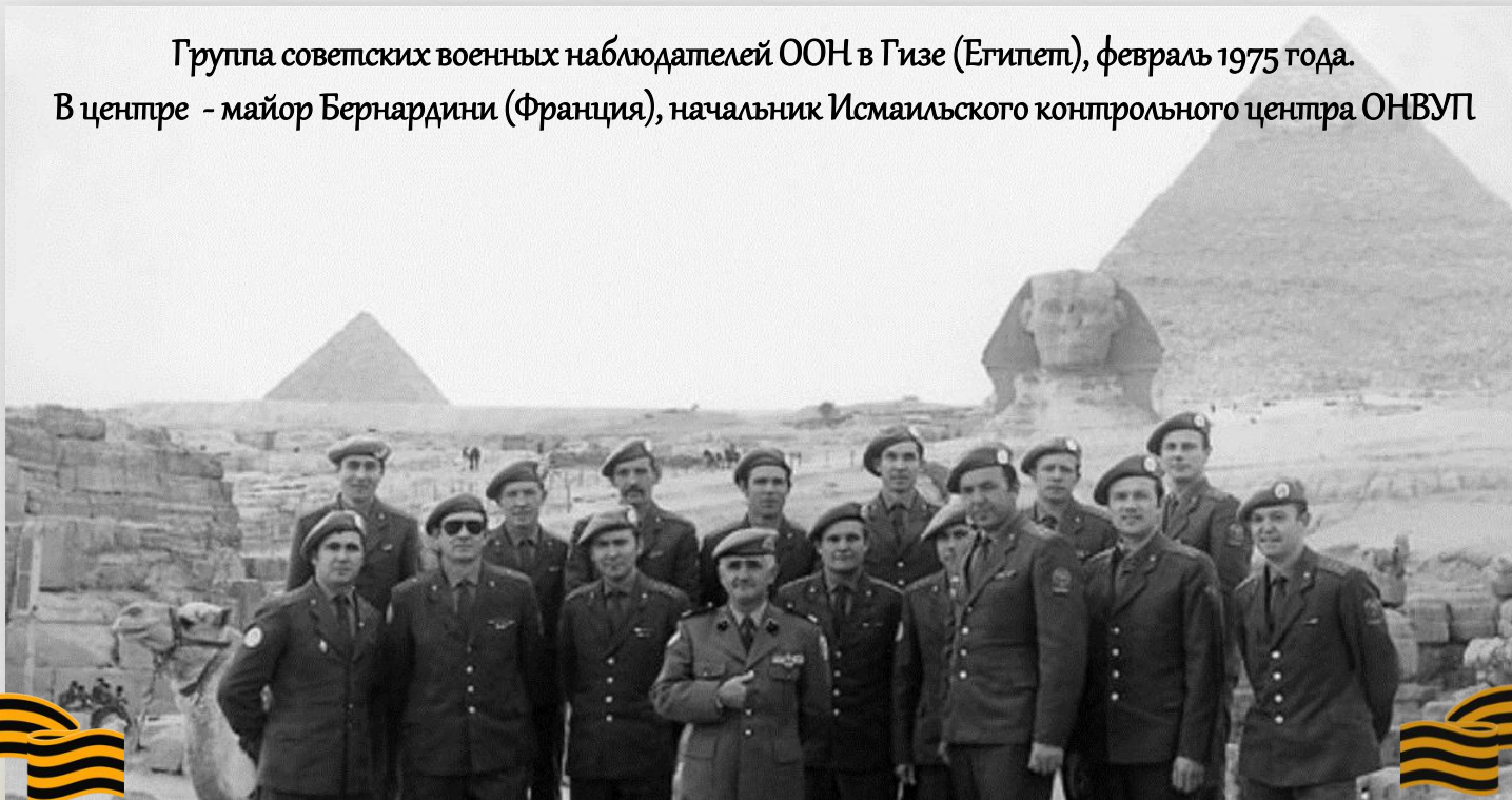
Группа советских военных наблюдателей ООН в Гизе (Египет), февраль 1975 года. В центре - майор Бернардини (Франция), начальник Исмаильского контрольного центра ОНВУП

В Египте советские военнослужащие находились в начале 1970-х гг., причём, туда направлялись не только военные советники. В марте 1970 г. в Египет прибыли 1,5 тыс. советских военнослужащих зенитно-ракетных войск и около 200 лётчиков истребительной авиации. К концу 1970 г. в Египте находилось около 20 тыс. советских солдат, матросов и офицеров, проходивших службу на военных кораблях в зоне Суэцкого канала, в зенитно-ракетных дивизионах и в истребительной авиации. Потери советских войск во время войны Египта с Израилем составили более 40 военнослужащих.