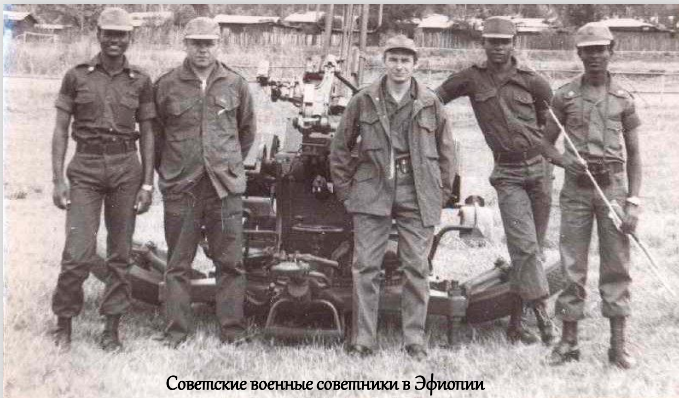
Советские военные советники в Эфиопии

В 1977-1979 гг. советские военнослужащие принимали участие в Огаденской войне, вспыхнувшей между Сомали и Эфиопией. В ней СССР поддерживало молодое революционное правительство Эфиопии, в помощь которому направлялась военная техника, а также специалисты для её обслуживания. Благодаря советской и кубинской военной помощи Эфиопии удалось одержать победу в Огаденской войне.