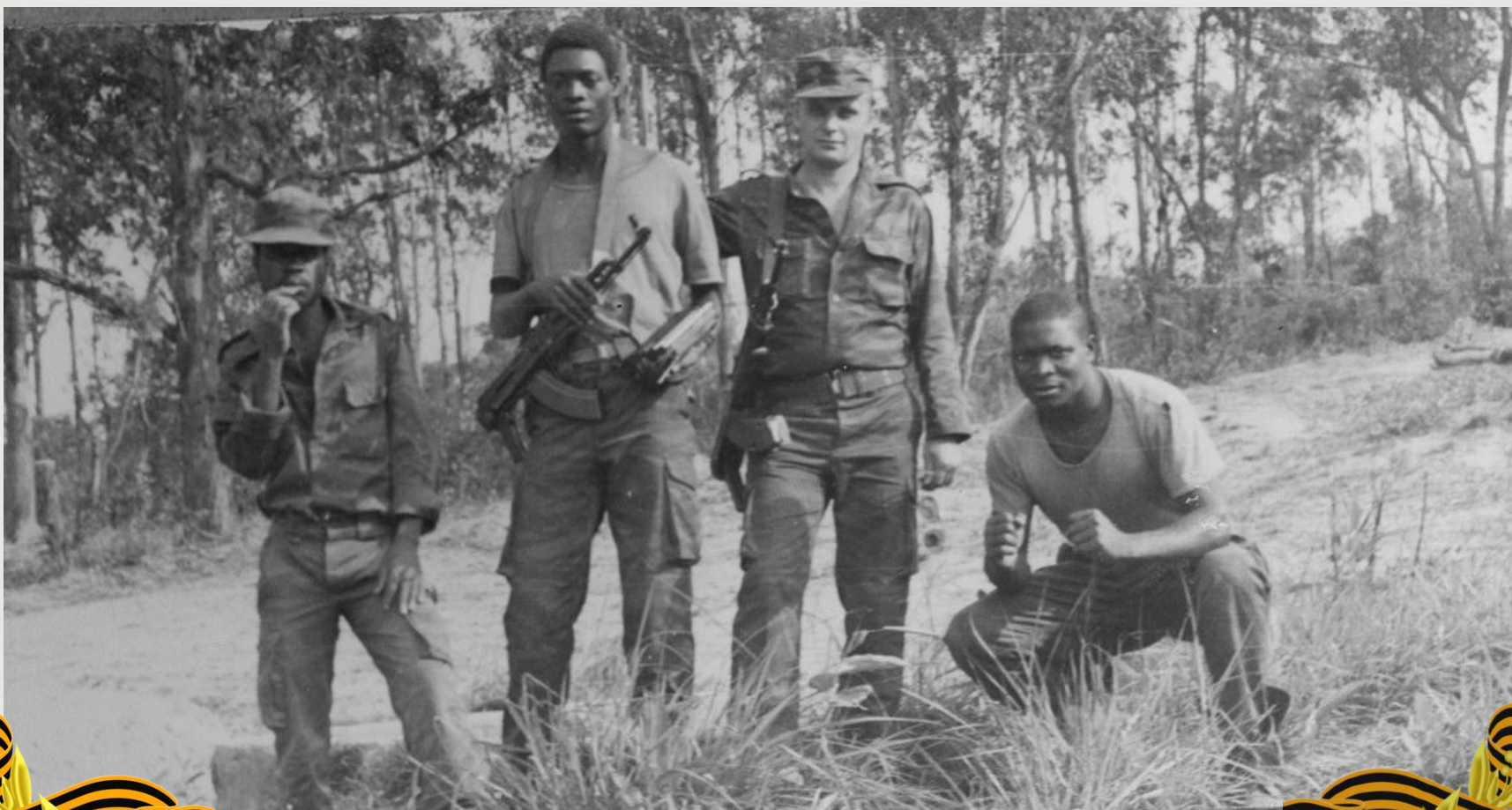
Советские советники в Анголе

В отличие от Афганистана, участие советских военнослужащих в боевых действиях в Африке практически не афишировалось.