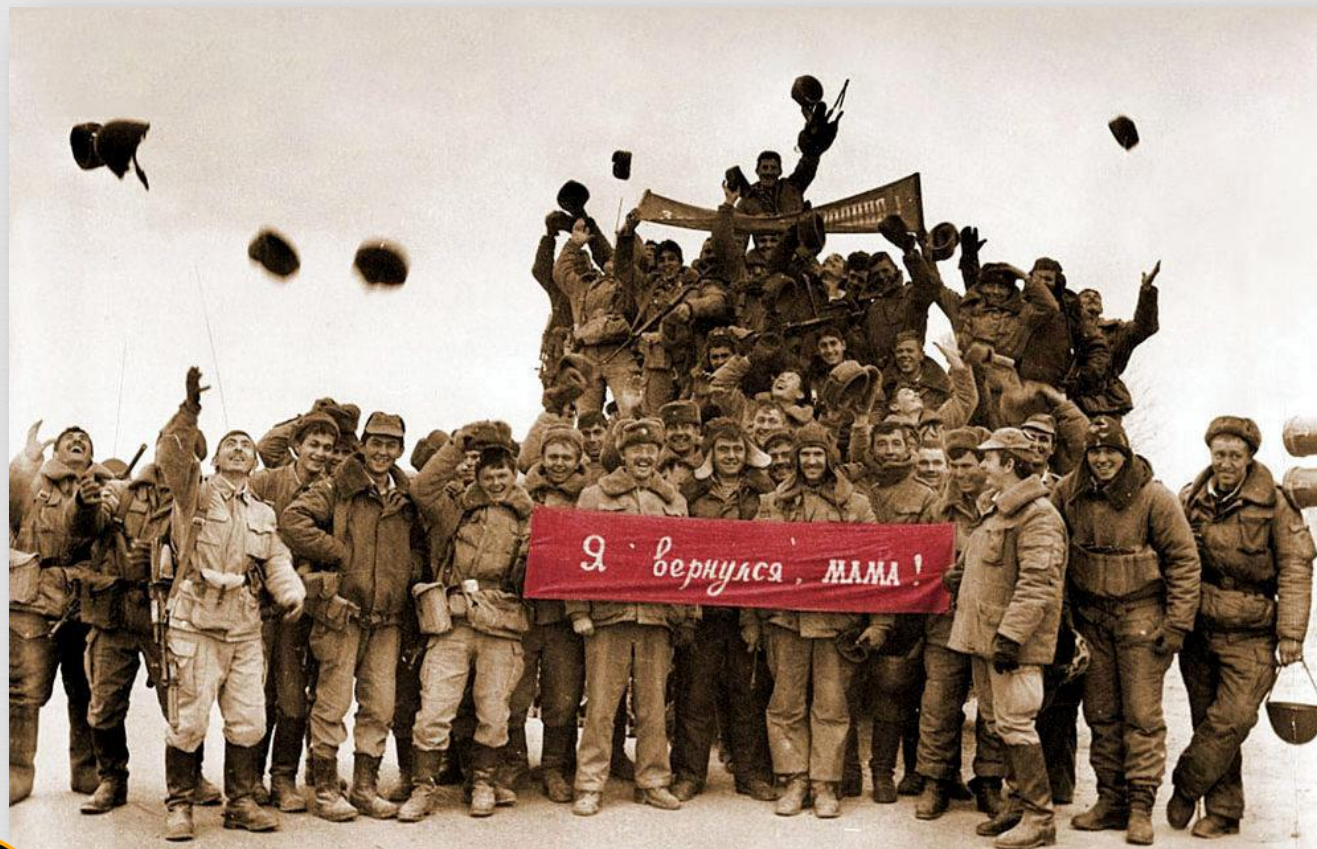
Вывод войск из Афганистана

По данным Минобороны, после окончания Второй мировой войны 1,5 млн. советских и российских граждан приняли участие в более чем 30 войнах и вооруженных конфликтах за пределами страны в нескольких десятках государств Азии, Африки и Латинской Америки - Афганистане, Анголе, Эфиопии, Вьетнаме, Корее, Мозамбике, Никарагуа, на Кубе, в республиках бывшего СССР, Югославии и др. При исполнении служебного долга за рубежом погибли около 25 тыс. советских и российских граждан.